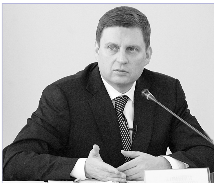
Председатель Законодательного Собрания Андрей Епишин

Постоянно в центре нашего внимания и вопросы поддержки малого бизнеса. Так в ноябре сразу в двух чтениях был принят закон «О патентной систе-