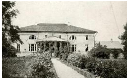
(имение Рачинских, Бобровка)

Ныне, странники, с вами я: скоро ж Дымным дымом от вас пронесусь — Я — просторов рыдающих сторож, Исходивший великую Русь.