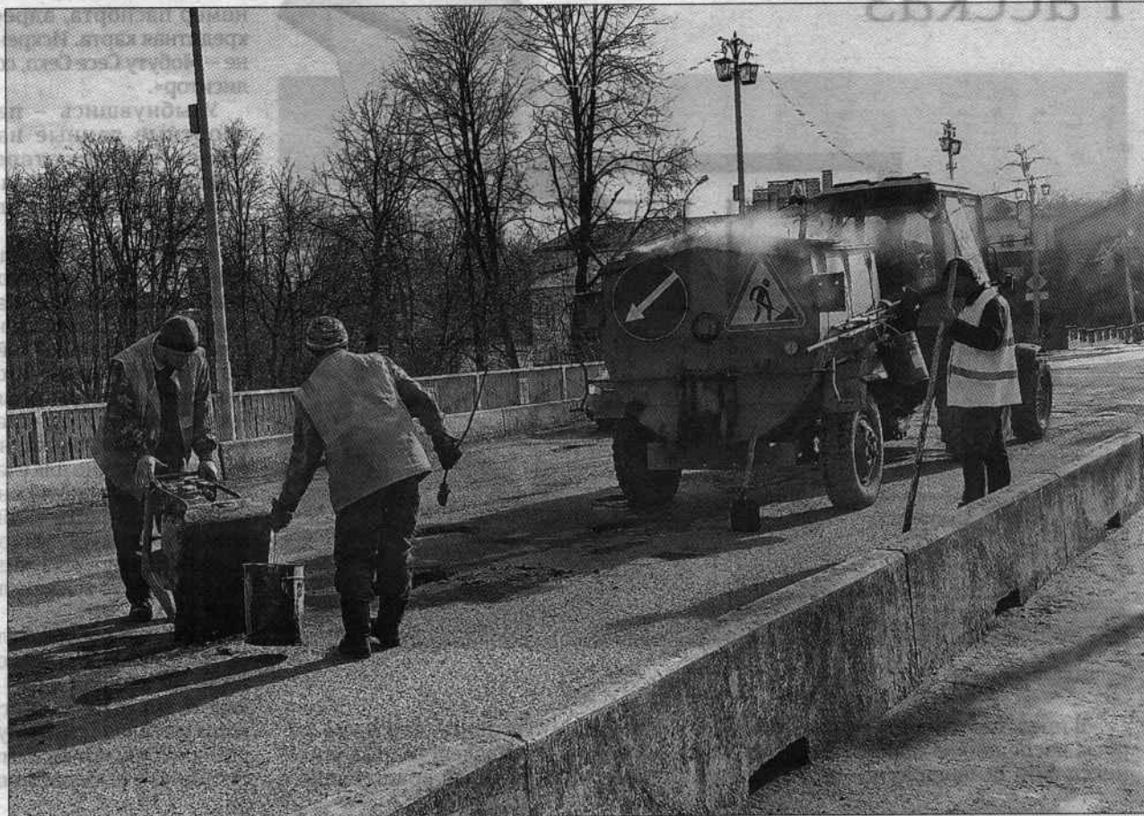
В этом году в регионе планируется отремонтировать более 163 км муниципальных дорог — на 60 км больше, чем в 2018-м.

21 марта в муниципалитете отметили Международный день воды. Праздник прошел в районной детской библиотеке. Мальши из детских садов с удивлением узнали, что если, к примеру, папа весит 70 килограммов, то в нем 4 ведра воды, и что без нее человек может прожить всего 3 дня. А слону в сутки нужно не менее 90 литров. Ребята постарше с