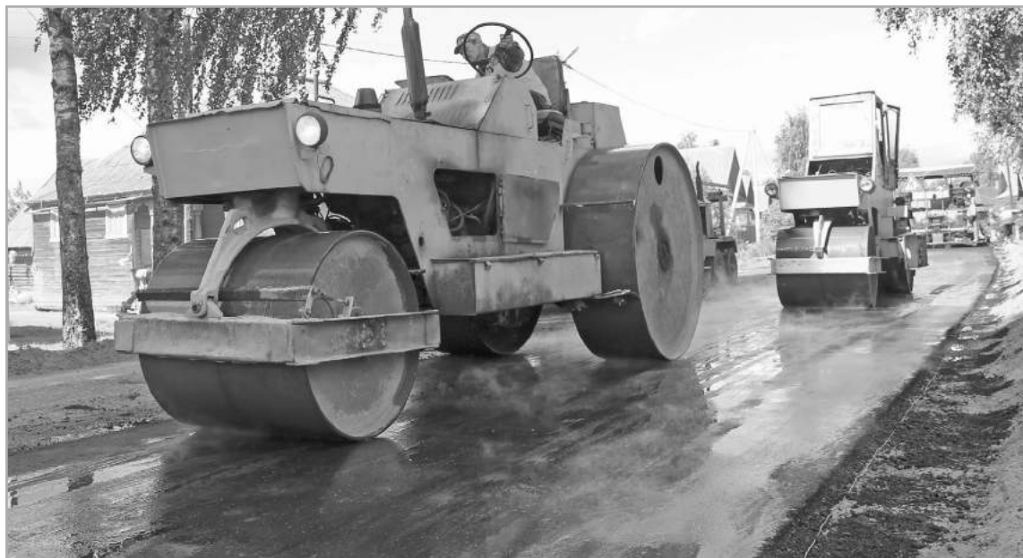
Хорошие дороги открывают новые возможности развития экономики

В нынешнем году здесь ждут еще больше гостей в связи с празднованием значимой для многих православных даты – 350-летия обретения мощей Нила Столобенского. Есть надежда, что за дороги, которые ведут к монастырю и к озеру Селигер, попавшему в сотню самых узнаваемых региональных брендов России, краснеть не придется. Потому что региональная власть намерена в этом году привести их в нормативное состояние. Будут отремонтированы подъезды к Нило-Столобенской пустыни Залесье – Сорога – Ореховка – Дубровка и Сорога – Залучье – Светлица в Осташковском районе общей протяженностью 20