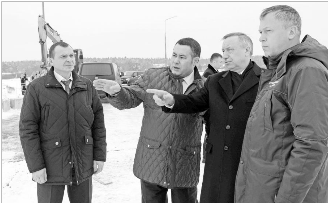
Игорь Руденя и Александр Беглов убедились, что строительство развязки на федеральной трассе М-10 на въезде в Тверь удастся завершить даже раньше установленного срока

Они осмотрели современный издательско-полиграфический комплекс «Парето-Принт», транспортные развязки на федеральной трассе М-10 в районе съезда на деревню Николо-Малица и на пересечении со Старицким шоссе. В Чуприяновке посетили детский сад, строительство которого было возобновлено и завершено в этом году, и железнодорожный переезд, где идет подготовка к строительству автомобильной развязки.