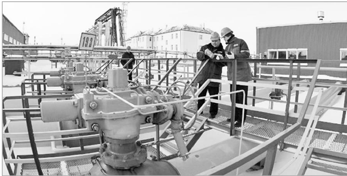
Правительство области намерено обеспечить выполнение плана-графика работ в рамках реализации программы развития газоснабжения и газификации на период с 2016 по 2020 годы

– Наличие природного газа – один из определяющих факторов для инвесторов, выбирающих территорию для реализации своих проектов. В нашем районе уровень газификации более 70%, а по Калязину – около 93%. Готовим документацию и надеемся в 2018 году газифицировать еще ряд населенных пунктов. Это будет способствовать реализации нескольких крупных инвестиционных проектов в сфере туризма и сельского хозяйства. Речь о строительстве кроличьей фермы на 70 тыс. голов, круглогодичных теплиц – биовегетариев и объектов размещения в сфере историко-ландшафтного туризма.