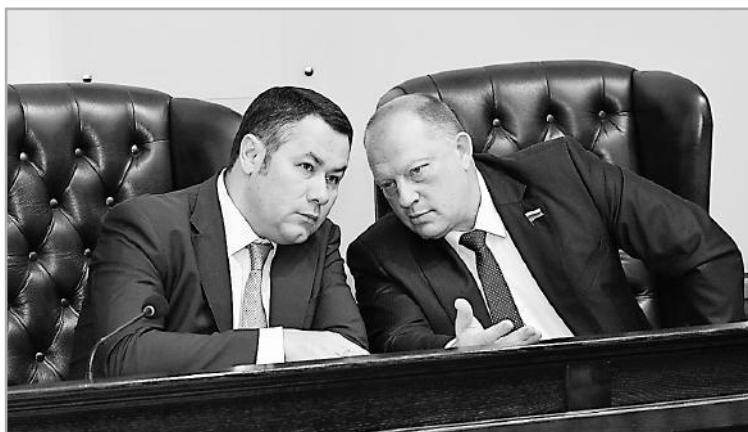
Новые областные власти ставят амбициозную задачу – сделать Тверскую область одним из лидеров в ЦФО

Как отметил на первом заседании Заксобрания губернатор Игорь Руденя, новому депутатскому корпусу предстоит решить ряд серьезных задач, в том числе – принять комплексную программу развития Тверской области на пять лет и региональный бюджет на 2017-2019 годы.