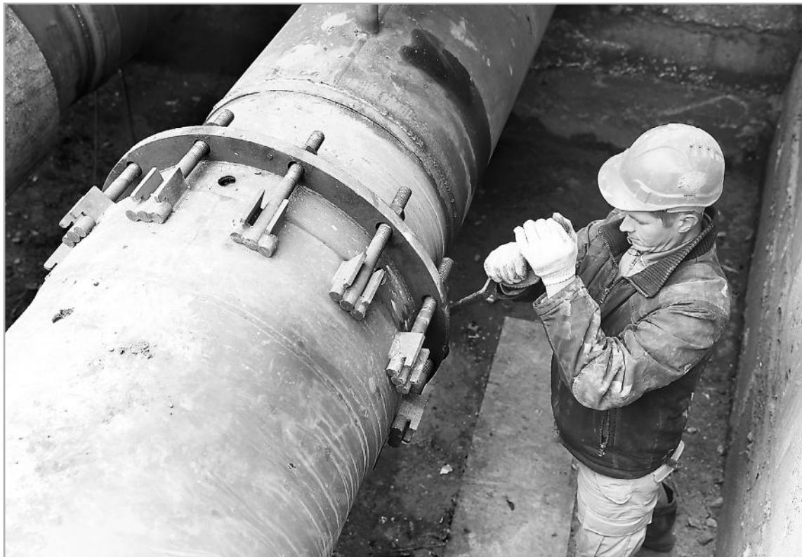
Проблемы с подключением тепла в некоторых муниципалитетах решились только после вмешательства регионального Правительства

тора просто физически не может уследить за всеми раскопками, Игорь Руденя посоветовал поработать и главам районов. А точнее – походить ногами, не на машине, по вверенной территории, и выяснять, что происходит на улицах и во дворах. Ну и главное: раскопки отныне должны производиться только после закупки всех необходимых материалов для ремонта и замены инженерных сетей.