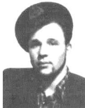
Фото и текст из книги В. Кириллова «Хранители очага».